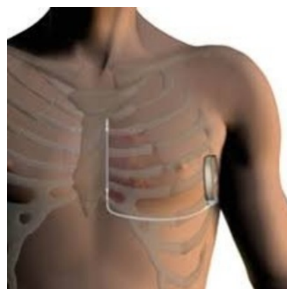
Figuur: 1 S-ICD

De ICD-verpleegkundige zal met u de verschillen tussen het transveneuze systeem en het S-ICD systeem verder toelichten.