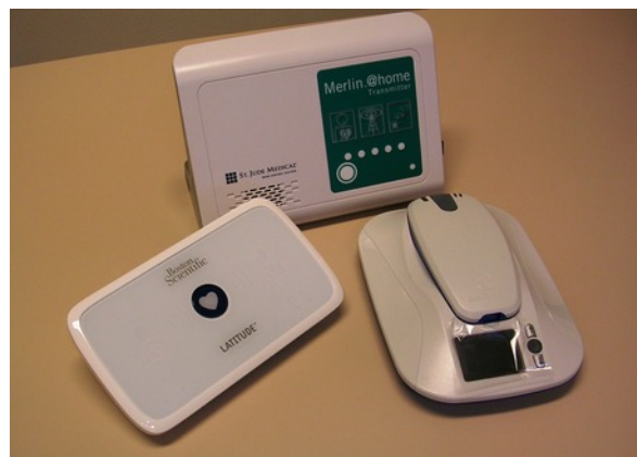
Figuur 3: afbeeldingen van verschillende Remote-care apparaten

Remote-Care is een extra service. Het is geen 24-uurs continue bewaking! Bij het krijgen van shock van de S-ICD dient u altijd contact op te nemen.