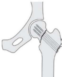
Fixatie met 'Schroeven Gammanail'

Er zijn verschillende operatietechnieken om een heupbreuk te behandelen. Het soort operatie hangt af van het gedeelte van de heup die gebroken is, de ernst van de breuk en de leeftijd van de patiënt. De reparatie kan worden gedaan met behulp van een metalen pen of plaat en schroeven of met een kunstheup (prothese). Indien u een prothese heeft gekregen door de orthopedisch chirurg, is de patiëntinformatie folder van de totale heupprothese ook voor u van belang, omdat daar informatie in staat die op de revalidatie van toepassing is.