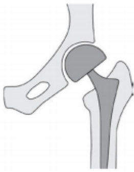
Fixatie 2 met Kop- halsprothese