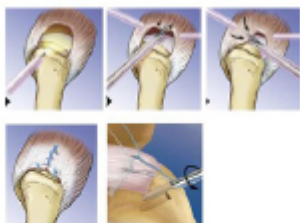
Figuur 2. hier wordt de gescheurde rotator cuff met behulp van een anker en draden gehecht en weer op het bot getrokken.

Tijdens uw bezoek aan de polikliniek bespreekt de orthopedisch chirurg met u de operatie en de daaraan verbonden verwachtingen en risico's.