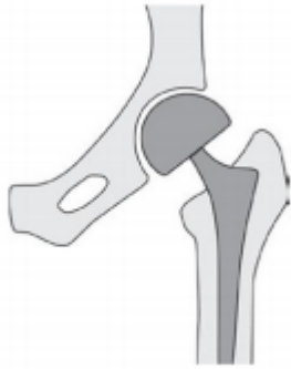
Fixatie 2 met Kop- halsprothese