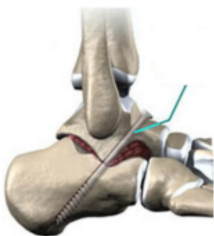
Figuur 4 (vastzetten OSG gewricht)

Wanneer sprake is van matige tot ernstige artrose van de achtervoet wordt gekozen voor de standaard procedure. Hierbij wordt het gewricht tussen het sprongbeen en het hielbeen (zogenaamde ondersta spronggewricht (OSG), zie figuur 4) vastgezet. Dit vastzetten gebeurt met één of meerdere grote schroeven. Vervolgens moet het lichaam beide botdelen aan elkaar laten vastgroeien.