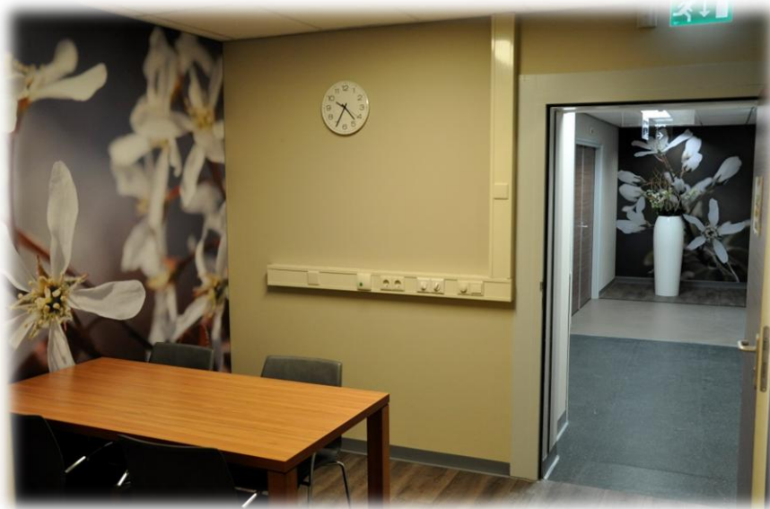
Figuur 2. Toegang PET/CT scanner Nucleaire geneeskunde