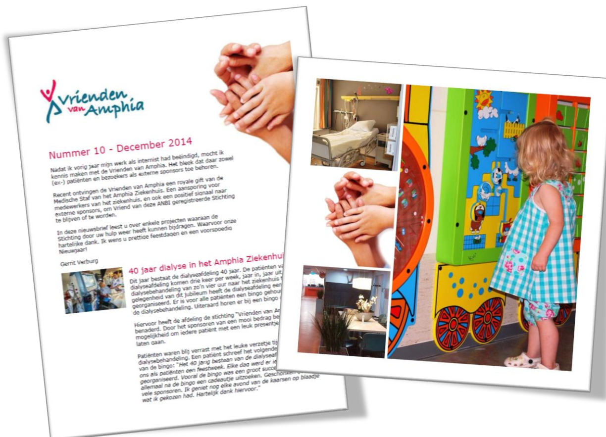
Figuur 5. Uiterlijk van de nieuwsbrief (links) en Facebook project afbeelding (rechts)

In samenwerking met de kenniskern Communicatie en Marketing van het Amphia Ziekenhuis verzorgt de stichting een kwartaalnieuwsbrief waarmee donateurs en belangstellenden worden voorzien van nieuws en informatie over de stichting en haar projecten. Vanaf 2014 wordt hiervoor gebruik gemaakt van het nieuwsbriefstelsel dat het Amphia Ziekenhuis gebruikt voor haar relaties. De nieuwsbrief is hierdoor eenvoudiger samen te stellen en op te maken en heeft een nieuw uiterlijk gekregen.