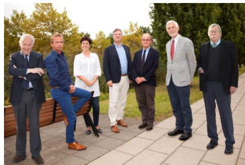
Figuur 1. Bestuur Vrienden van Amphia