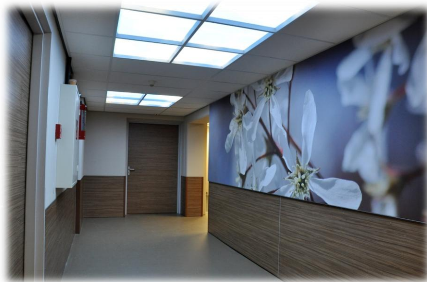
Figuur 4. Toegang PET/CT scanner Nucleaire geneeskunde

Bij een voorlopig akkoord vult de aanvrager het formulier in incl. offertes en wordt de aanvraag in de bestuursvergadering besproken. Op basis van de uitkomst kan het project al dan niet gestart worden.