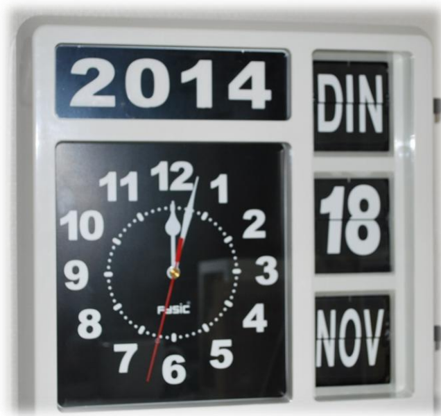
Figuur 3. Wand- en kalenderklok